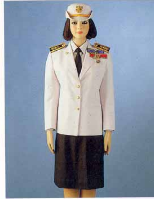
เครื่องแบบเต็มยศข้าราชการพลเรือนระดับจัตราภรณ์มงกุฎไทยร่วมกับเบญจมาภรณ์มงกุฎไทย