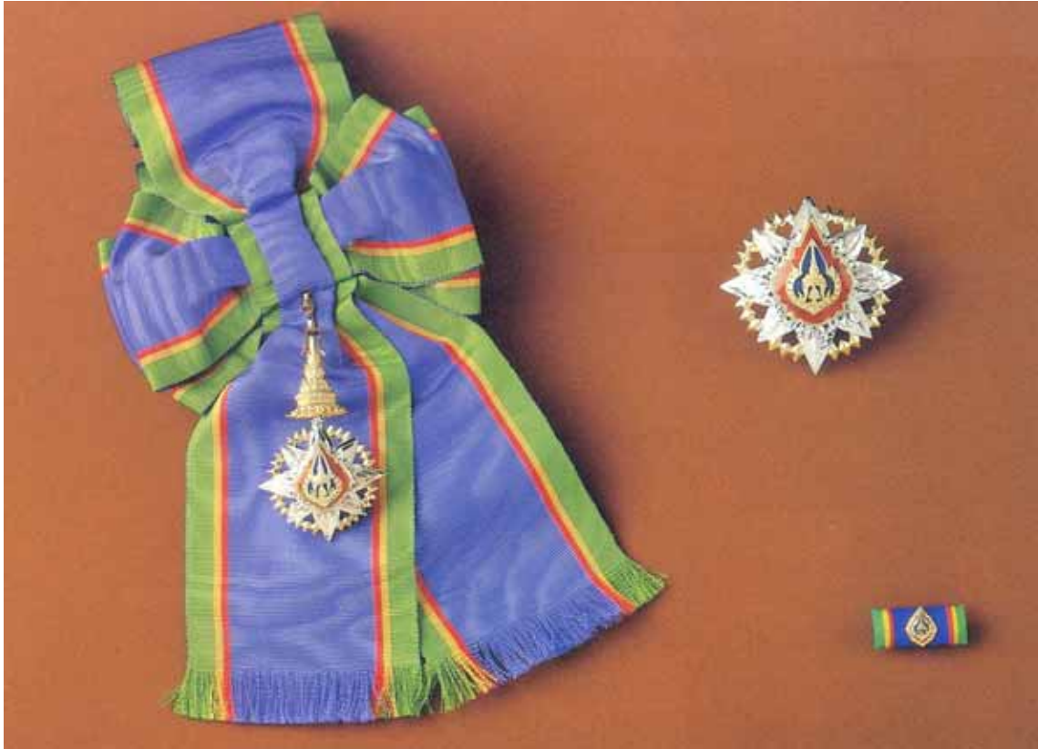
ประดมาภรณ์มงกุฎไทยสำหรับสตรี