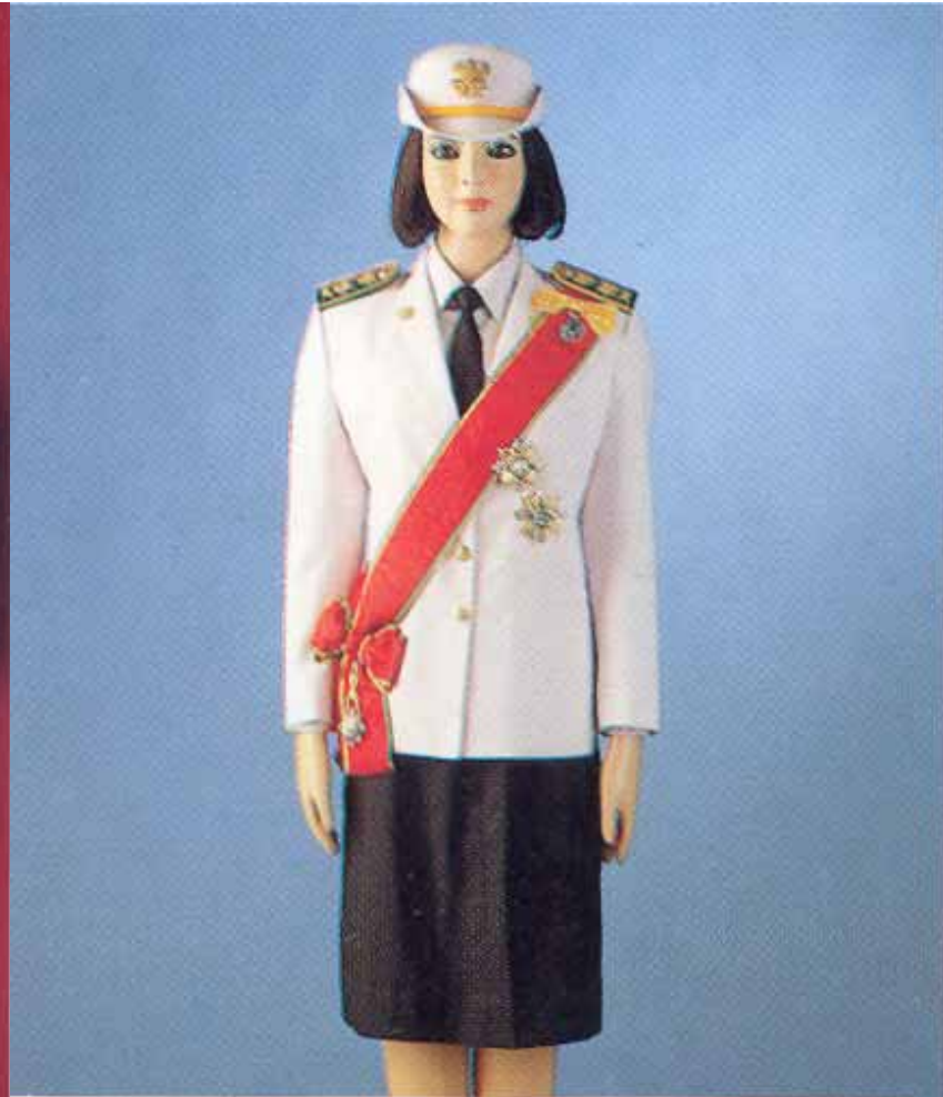
การประดับดาราและสายสะพายมหาปรมาภรณ์ช้างเผือก ร่วมกับดารา มหาวชิรมงกุฏ และเหรียญรัตนาภรณ์ ในเครื่องแบบเต็มยศข้าราชการพลเรือน