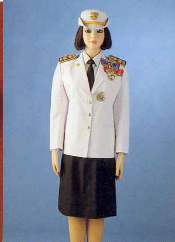
เครื่องแบบเต็มยศข้าราชการพลเรือน ระดับดารา และดวงตราทวีติยาภรณ์มงกุฎไทย ร่วมกับดวงตรา ตรีตาภรณ์ช้างเผือก