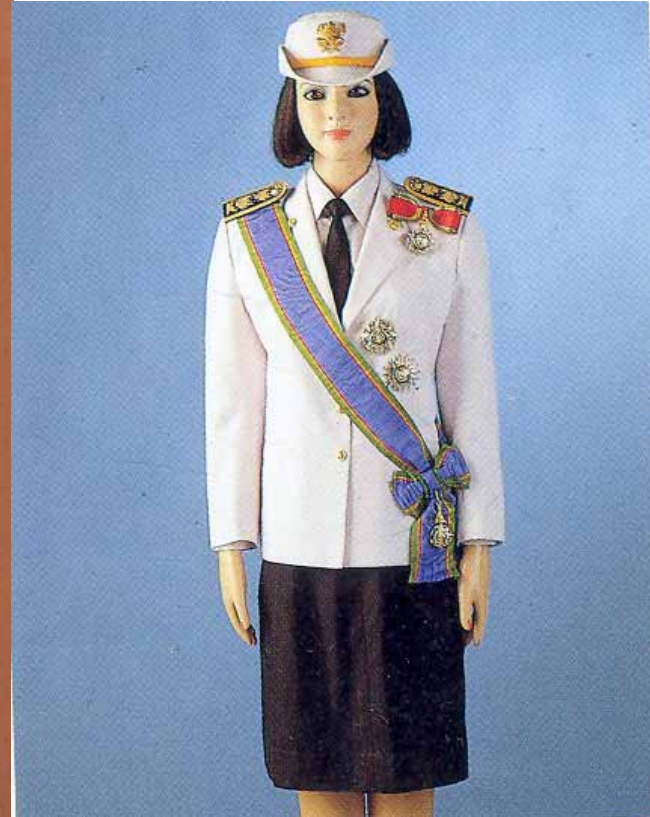
เครื่องแบบเต็มยศข้าราชการพลเรือน