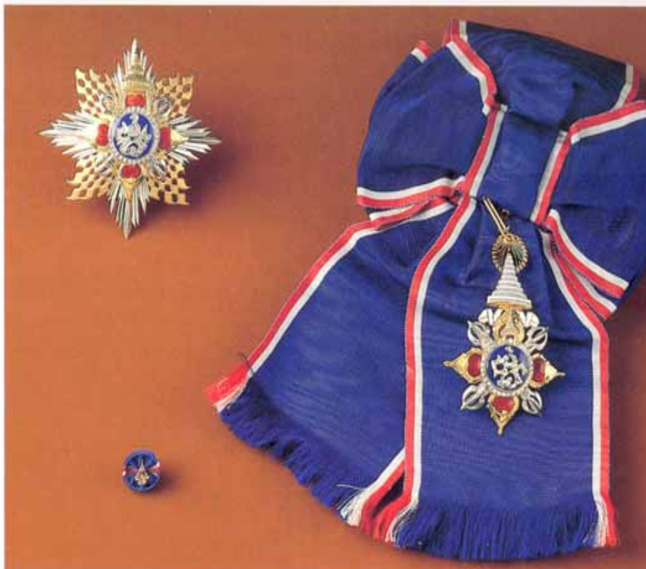
มหาวชิรมงกุฎสำหรับบุรุษ