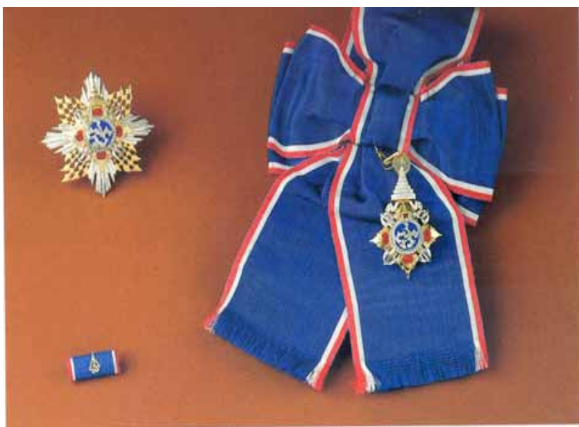
มหาวชิรมงกุฎสำหรับสตรี

การแต่งกายเครื่องแบบเต็มยศ ข้าราชการพลเรือน สวมสาย สะพายมหา วชิรมงกุฎ ดารา มหาวชิรมงกุฎ ดาราประถมา ภรณ์ช้างเผือก และเหรียญ จักรพรรดิมาลาที่ หน้าบ่าซ้าย