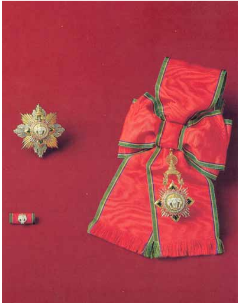
มหาปรมาภรณ์ช้างเผือกสำหรับสตรี