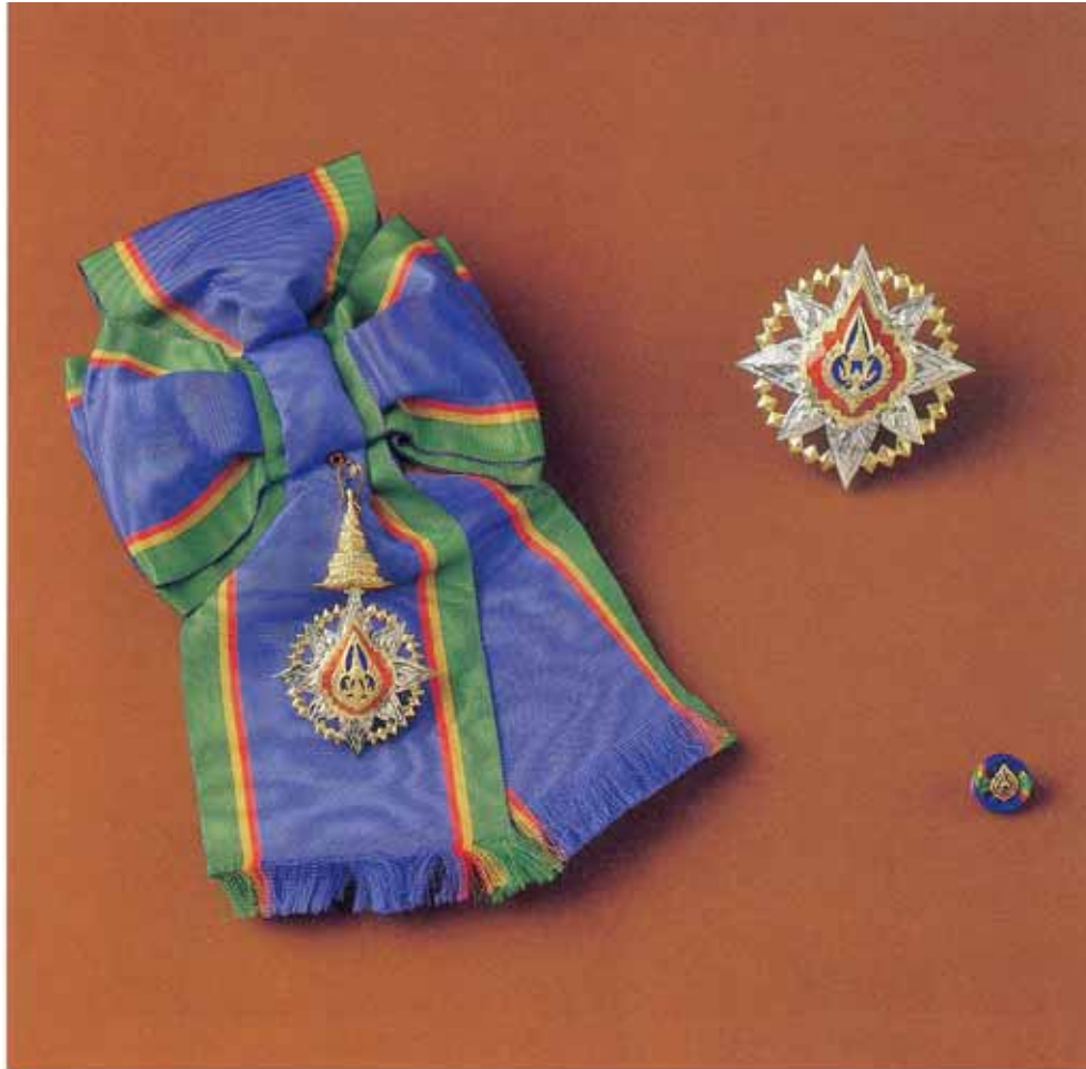
ประดมาภรณ์มงกุฎไทยสำหรับบุรุษ