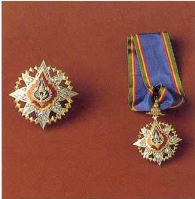
ทวีติยาภรณ์มงกุฎไทย บุรุษ