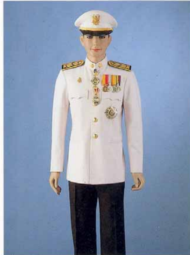
เครื่องแบบเต็มยศข้าราชการพลเรือน ประดับคารา และดวงตราทวีติยาภรณ์มงกุฎไทย ร่วมกับดวงตรา ตริตาภรณ์ช้างเผือก