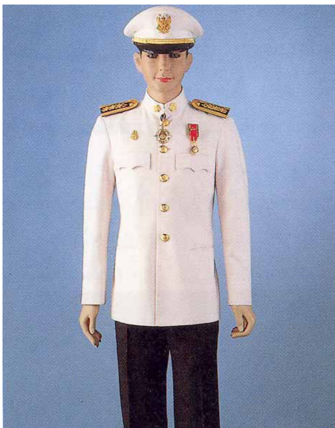
เครื่องแบบเต็มยศข้าราชการพลเรือนระดับตรีตาภรณ์ มงกุฎไทย ร่วมกับจักรยาภรณ์ช้างเผือก