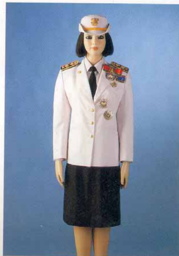
การประดับคาราและดวงตราวีติยาภรณ์ช้างเผือก ร่วมกับคาราและดวงตราวีติยาภรณ์มงกุฎไทย ในเครื่องแบบเต็มยศข้าราชการพลเรือน