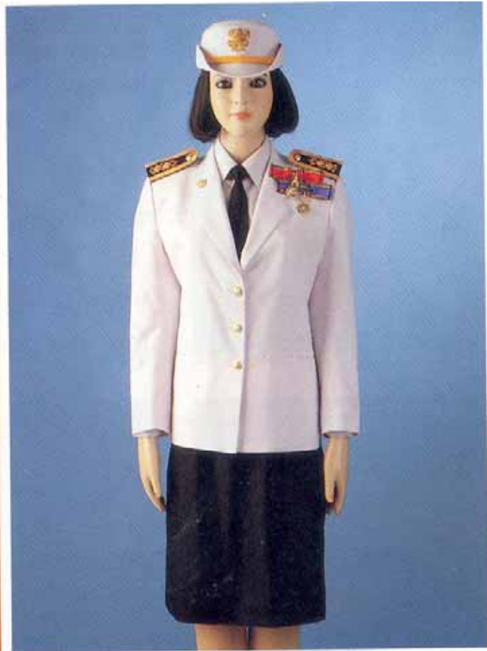
การประดับจตุรตถาภรณ์ช้างเผือก ร่วมกับจตุรตถาภรณ์ มงกุฎไทย ในเครื่องแบบเต็มยศข้าราชการพลเรือน