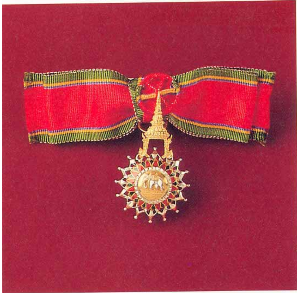
จตุรตถาภรณ์ช้างเผือกสำหรับสตรี