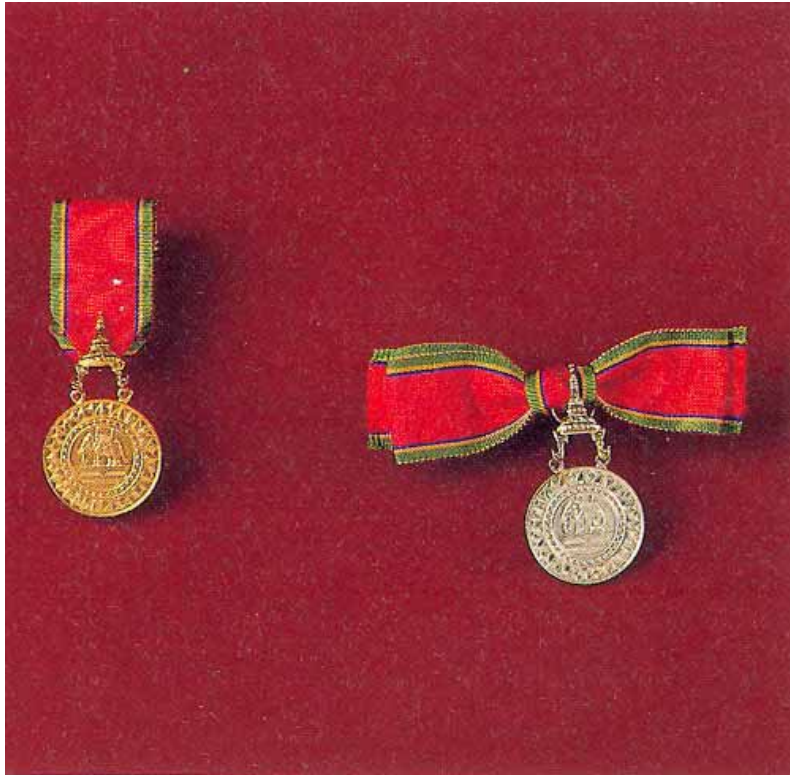
เหรียญทองช้างเผือก