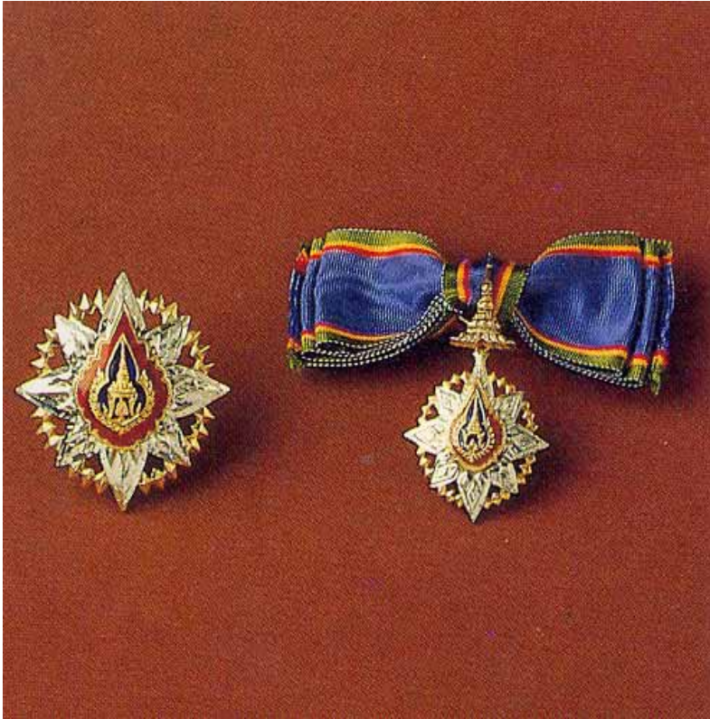
ทวีติยาภรณ์มงกุฎไทย สตรี