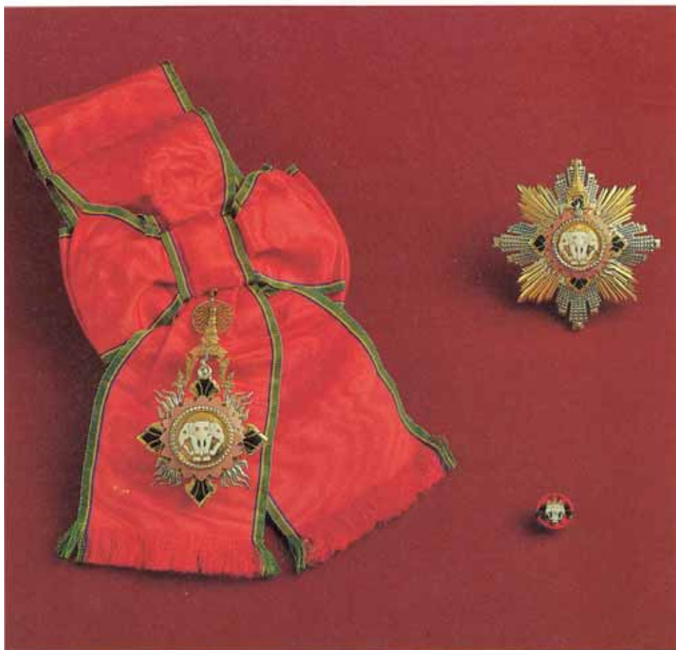
มหาปรมาภรณ์ช้างเผือกสำหรับบุรุษ