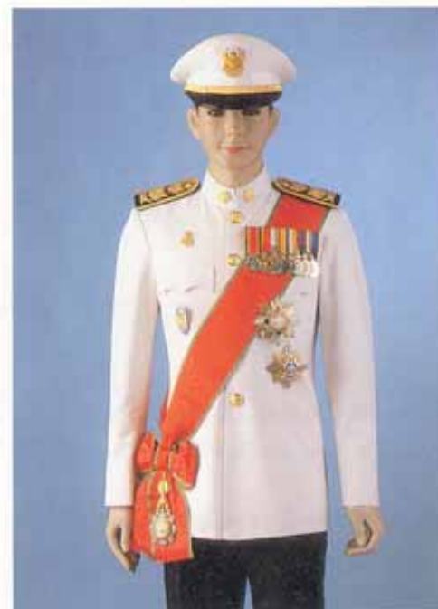
การประดับศราราและสายสะพายมหาปรมาภรณ์ ช้างเผือก ร่วมกับดารามหาวิกรมกุฎ และเหรียญ ราชอิสริยาภรณ์ต่างๆในเครื่องแบบเต็มยศข้าราชการ พลเรือน