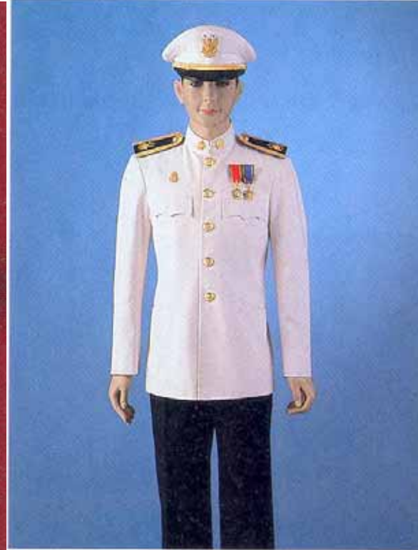
การประดับเบญจมาภรณ์ช้างเผือก ร่วมกับเบญจมาภรณ์ มงกุฎไทย ในเครื่องแบบเต็มยศข้าราชการพลเรือน