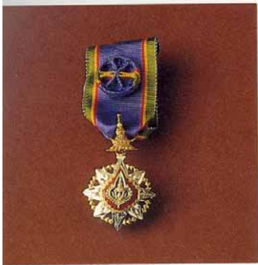
จัตราภรณ์มงกุฎไทย บุรุษ