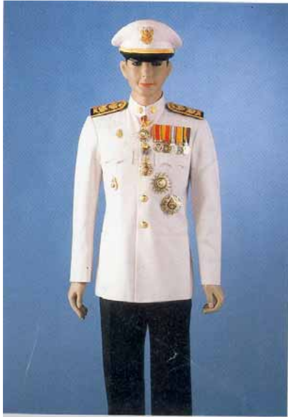
การประดับคาราและดวงตราวีติยาภรณ์ช้างเผือก ร่วมกับคาราและดวงตราวีติยาภรณ์มงกุฎไทย และ เหรียญราชอิสริยาภรณ์ต่างๆ ในเครื่องแบบเต็มยศ ข้าราชการพลเรือน